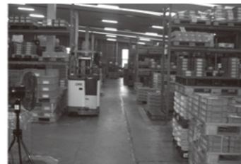
倉庫内は自動車部品の在庫管理