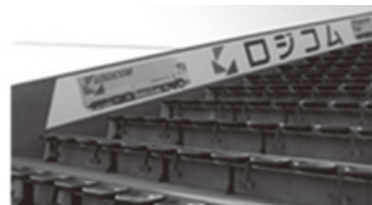
MAZDA zoom-zoom スタジアムに看板が設置されました!!