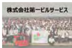
株式会社第一ビルサービス